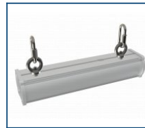
Кронштейн Diora Piton рым-болт (комплект)