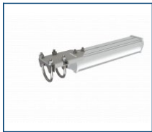
Кронштейн консольный Piton/Angar (комплект)